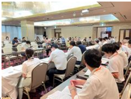
(さいたま市との懇談プリムローズ有朋)

社保協からの参加は延べで431団体、1101人、自治体は953人でした。一部の自治体では、懇談項目ごとに職員の入替えがありました。ほぼ、コロナ前に戻った懇談ができました。コース責任者、副責任者から届いた「懇談報告書」で、共通していることは、国保税の統一方針により、国保税が引き上がっている状況の中で、国や県の方針どおりにやっています。国庫補助金の増額を国・県に要望していくことは強調しますが、住民の暮らしの実態や声を国に届けていくような姿勢は見られませんでした。また、訪問介護報酬が引き下げられた中で、事業所の実態を掴んでいない自治体もありました。ヘルパーの高齢化と人手不足で悩む自治体も多くありまし